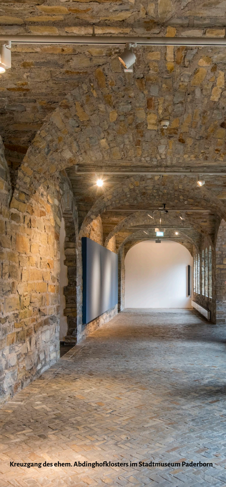
Kreuzgang des ehem. Abdinghofklosters im Stadtmuseum Paderborn