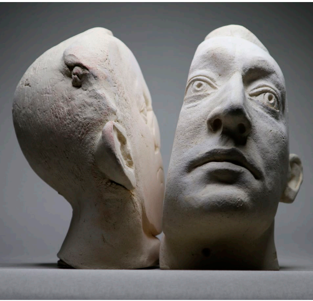
Oleksii Konoshenko Schöpfung. Zerstörung. Schöpfung 2, 2021 Schamotte · Höhe 25 cm