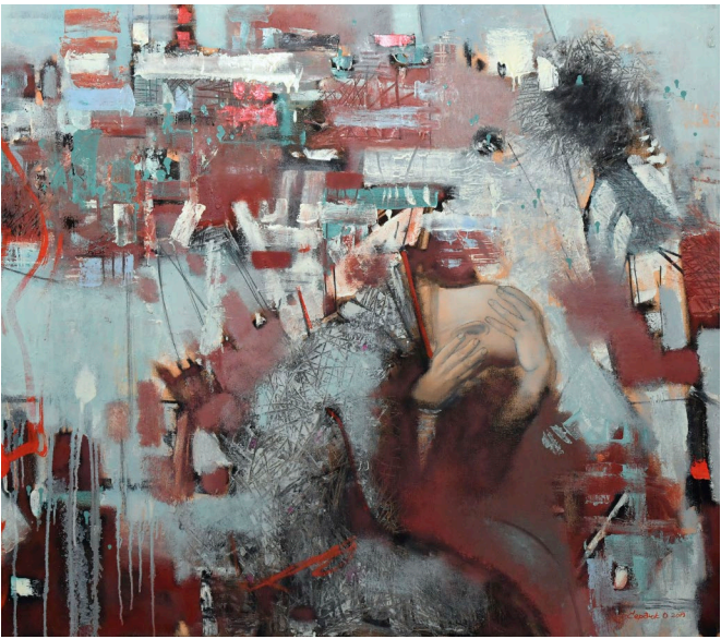
Oleksandr Serdyuk Im Trubel, 2019 Öl auf Leinwand · 100 x 120