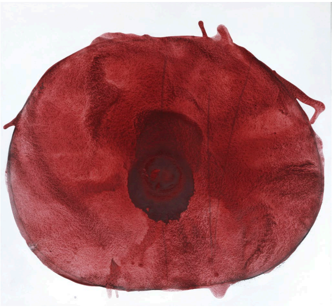
Viktoriia Romanchuk Die Schußwunde, 2022 Acryl auf Leinwand · 120 x 130