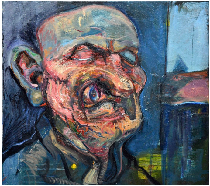
Sergij Sakharow Lemberg, 2020 Öl auf Leinwand · 50 x 50