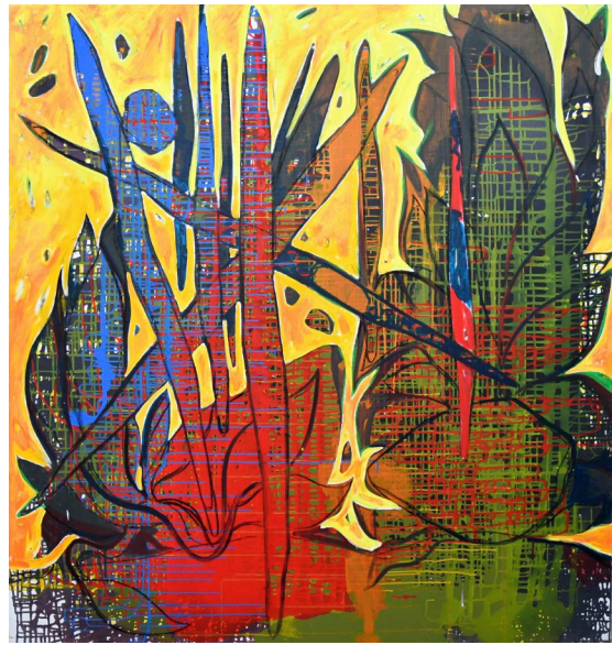
Petro Antyp Eine Blume, 2018 Mischtechnik auf Leinwand · 160 x 140