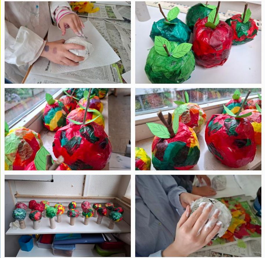
Kleisterarbeiten der 2c, es entstehen schöne Äpfel