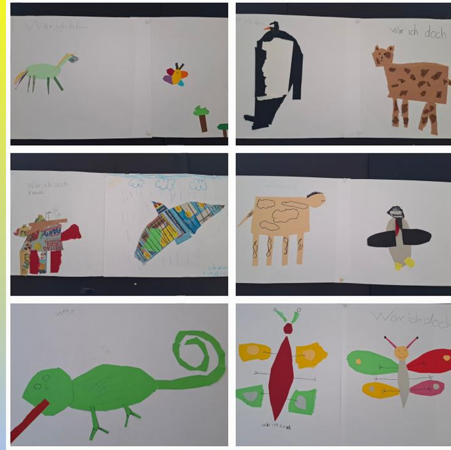
Collage zu Wunschtieren und Wunderblumen der 2c zum Bilderbuch „Wär ich doch...“.