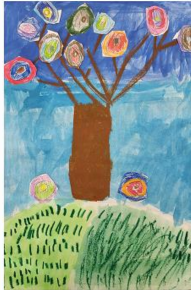
Bäume im Herbst der 3b