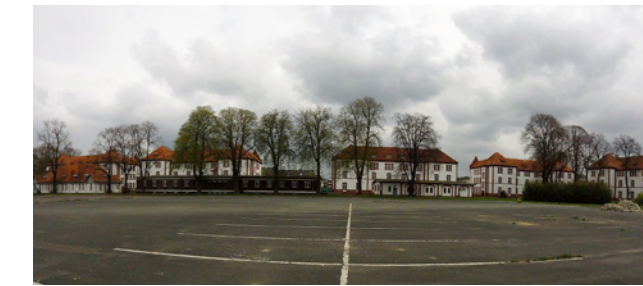
Gelände der Alanbrooke Barracks Kaserne

Die Ausstellung zeigt Fotos der britischen Kasernen in Paderborn zwischen dem Abzug des Militärs und dem Beginn der Konversion. Sechs Fotograf*innen haben über mehrere Jahre die Kasernen besucht und fotografisch dokumentiert. Die Ergebnisse dieser Fotoexkursionen werden im Stadtmuseum erstmals umfassend gezeigt. Eine historische Einführung informiert über die Geschichte der Kasernen. Einzelne Fundstücke geben Einblick in die Alltagswelten der Soldaten.